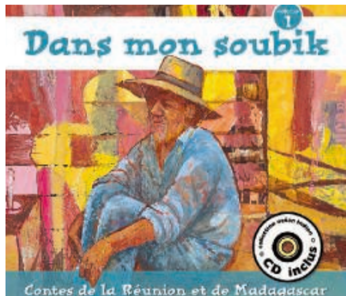
► Un incontournable du conte pays qui se lit et s'entend en même temps avec le meilleur de nos diseurs.